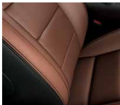
Skóra perforowana Salerno Tan Bez dopłaty dla Mustang i Mustang GT