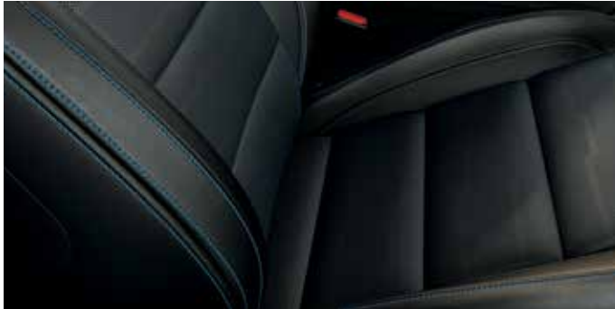
Skóra perforowana Lux Ebony z niebieskimi przeszyciami