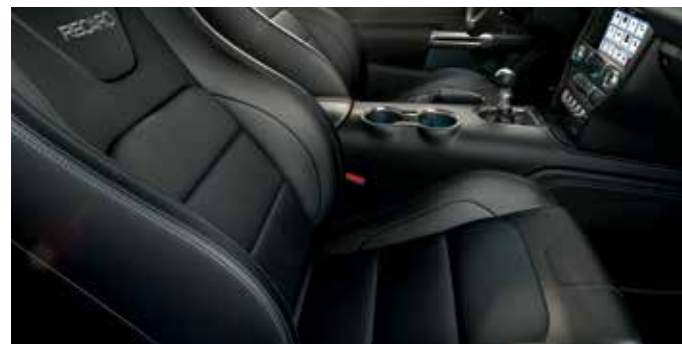
Fotele Recaro - skóra perforowana Lux Ebony z niebieskimi przeszyciami Dostępna tylko w pakietach Premium