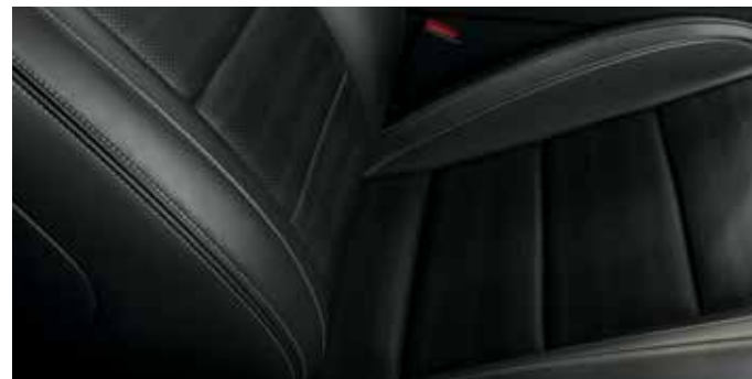
Skóra perforowana Lux Ebony z szarymi przeszyciami Dostępna tylko w pakietach Premium