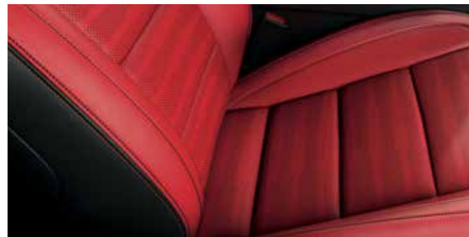
Skóra perforowana Lux Ebony Red przeszyciami w kolorze czarnym Dostępna tylko w pakietach Premium