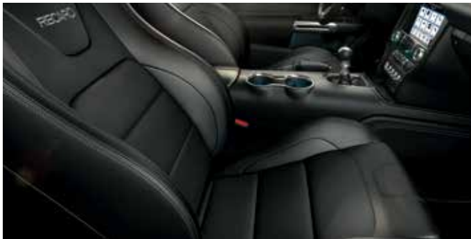
Fotele Recaro - skóra perforowana Lux Ebony z szarymi przeszyciami