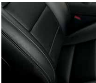
Skóra perforowana Salerno Ebony Standard dla Mustang i Mustang GT