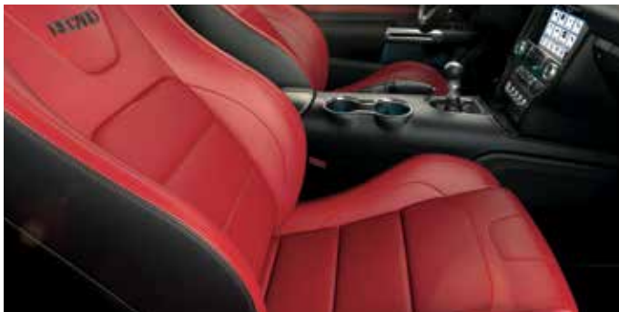
Fotele Recaro - skóra perforowana Lux Ebony z czerwonymi przeszyciami