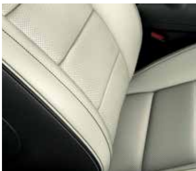
Skóra perforowana Salerno Ceramic Bez dopłaty dla Mustang i Mustang GT